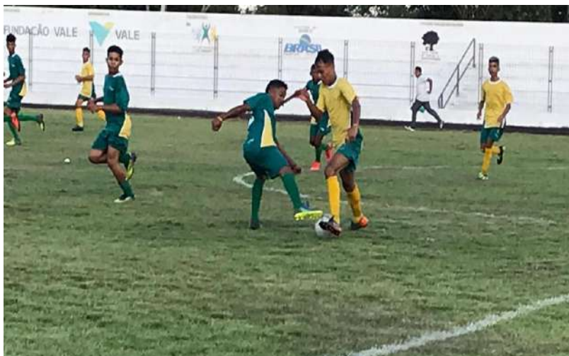
Jogo amistoso Arari e Marabá