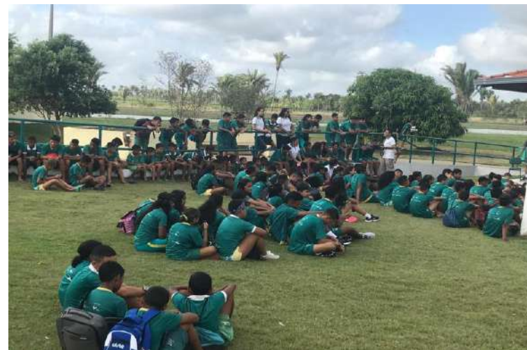
Acolhida no 1º dia do evento