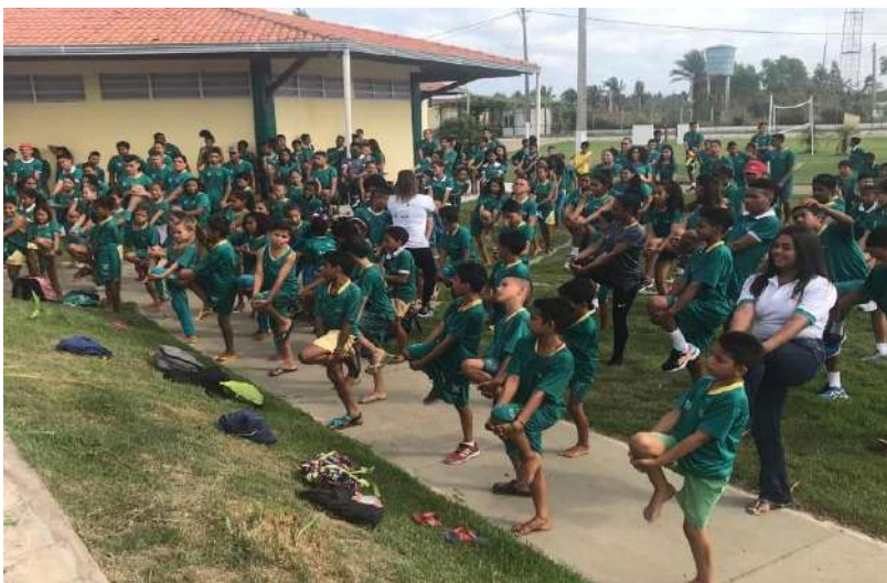
Momento de acolhida 2º dia Encontro