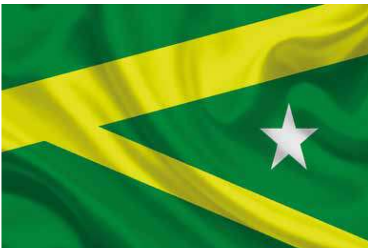
Bandeira do município de Marabá

O município de Marabá foi criado oficialmente em 27 de fevereiro de 1913, com instalação em 5 de abril do mesmo ano, data celebrada como aniversário da cidade. Em 27 de outubro de 1923, Marabá foi elevada à categoria de cidade por meio da Lei nº 2.207, consolidando institucionalmente sua importância regional.